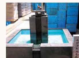
太田の清水源泉地

平安時代末頃、木曾(源)義仲がこの湧き水で馬を洗ったという古事から当地は洗馬(せば)と呼ばれるようになったそうです。当社敷地内に源泉地があり、塩尻市の名水に選ばれています。